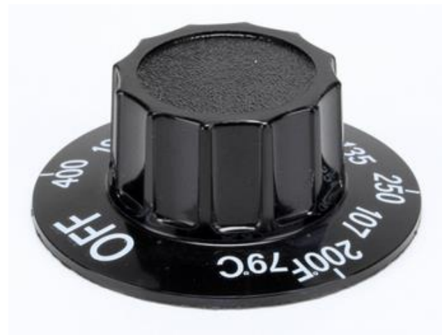
KNOB DO TERMOSTATO DE TEMPERADURA