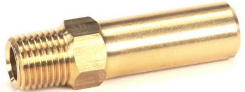
ORIFICIO DE GÁS GLP