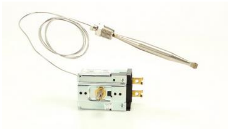
TERMOSTATO DE TEMPERATURA