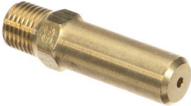
ORIFICIO DE GÁS GN