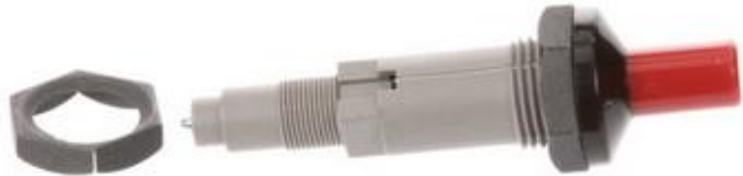
INGNITOR DE CHAMA