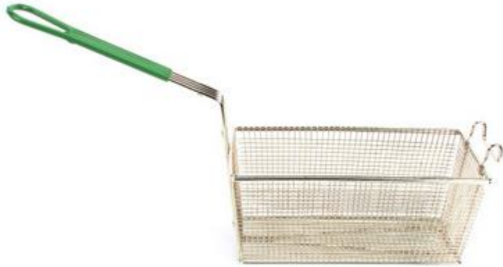
CESTO P/ CUBA SPLIT