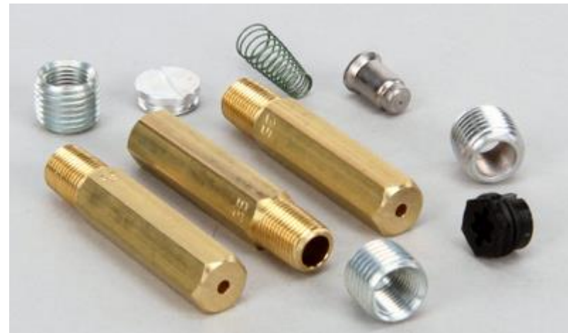
KIT DE CONVERSÃO DE GÁS GLP P/ GN