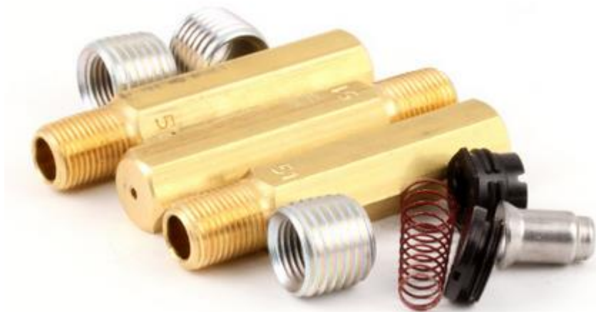
KIT DE CONVERSÃO DE GÁS GN P/ GLP