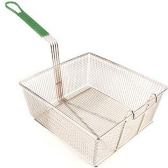
CESTO P/ CUBA FULL