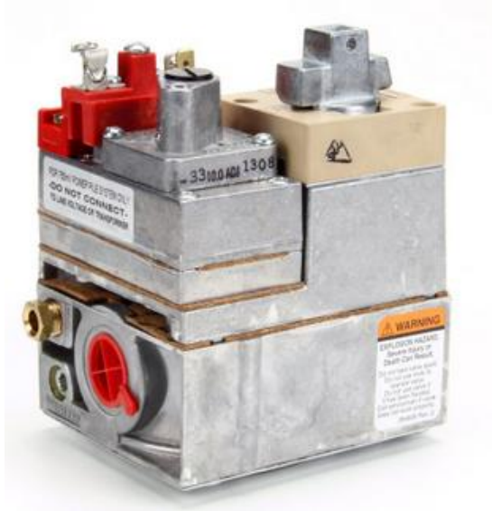
VÁLVULA DE GÁS GLP