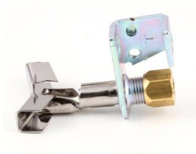
QUEIMADOR PILOTO P/ GÁS GLP